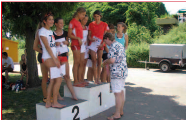
Siegerehrung mit unseren erfolgreichen Mädels