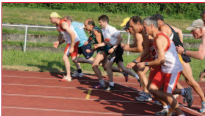
Start zum 1.500 m Lauf - letzte Disziplin in Zehnkampf