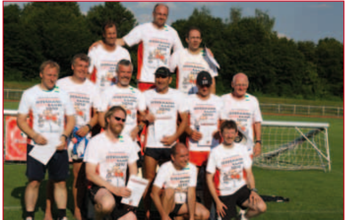
..... die Großen