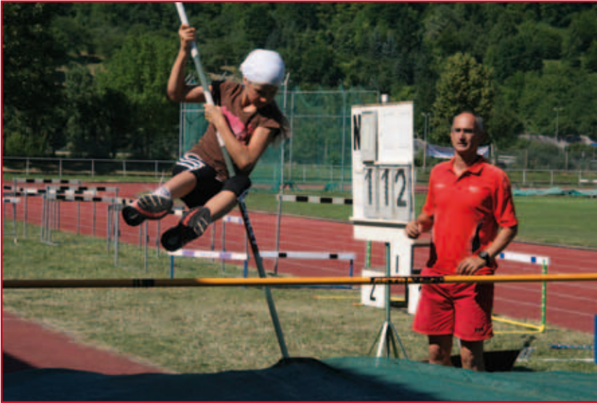
Früh übt sich - wer ein Meister werden will