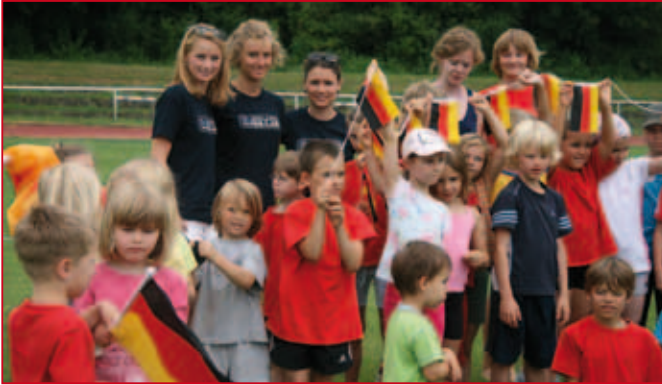
Alle sind Sieger - Die Kleinen und.....