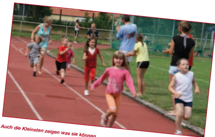
Auch die Kleinsten zeigen was sie können

Im Jedermann-Zehnkampf sind alle gefordert!