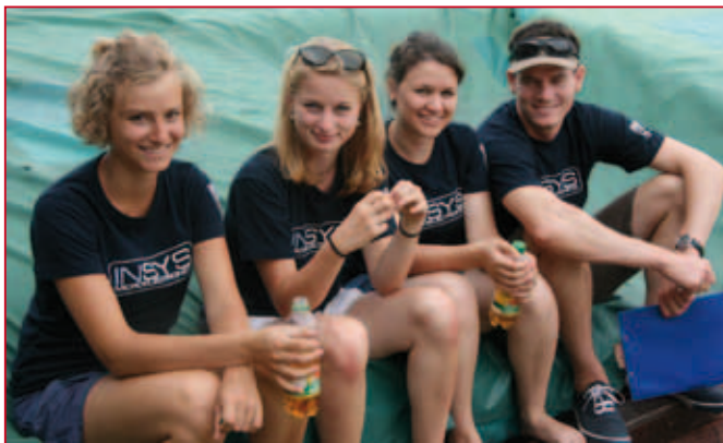
Auch die Helfer haben es geschafft!