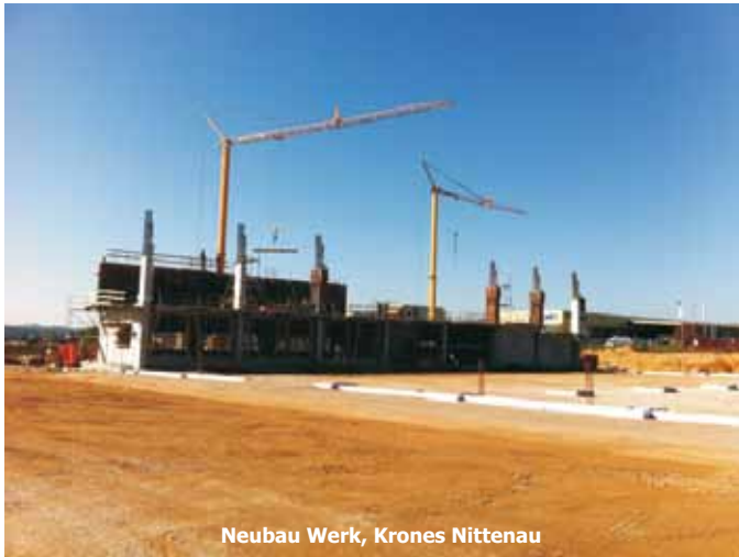
Neubau Werk, Krones Nittenau

RÖDL & HERDEGEN BAUUNTERNEHMEN GmbH Wöhrdstraße 42, 93059 Regensburg Telefon 0941/586860 Fax 5868610