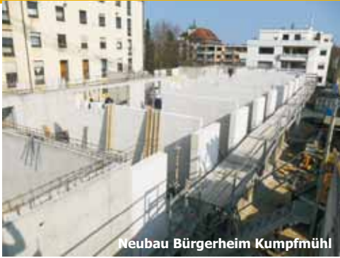
Neubau Bürgerheim Kumpfmühl