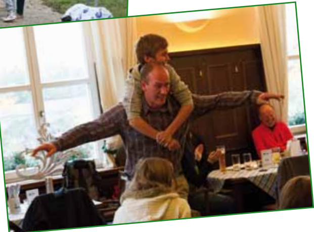
Impressionen von der Fuchsjagd am 21. Oktober 2012