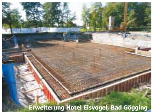
Erweiterung Hotel Eisvogel, Bad Gögging