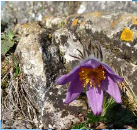
Linkes Bild: Kuhschelle; rechts: Kreuz mit Frauen

Wanderung über den Alpinen Steig am 31. März 2019