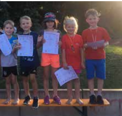
Erfolgreiche SWC-Leichtathleten U8-U12: Panther, Piraten und Löwen