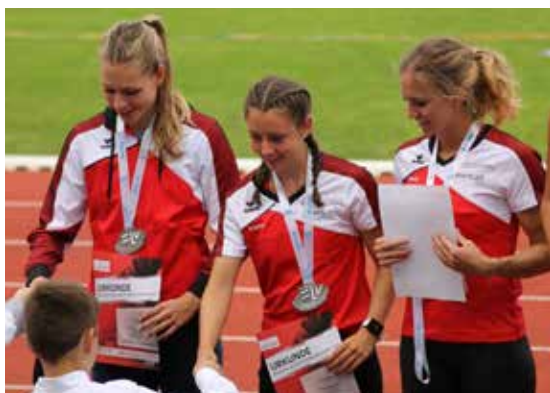
Die Silber-Staffel des SWC

Ohne Medaille blieben die SWC-Männer, Andi Plößl verpasste in einem starken Hochsprungfeld knapp Bronze trotz übersprungener 2,00m. Ordentlich verkaufte sich die 4x100m-Männerstaffel mit Moritz Geldhäuser, Marc Steger, Samuel Vogl und Markus Schwemmer, die mit 45,17sec und Platz Sieben das erhoffte Top-8-Ergebnis erreichte. Vom Staffellauf etwas angeschlagen konnte Moritz Geldhäuser tags darauf nicht wie gewohnt ins Stabhochsprung-Geschehen eingreifen, immerhin überquerte er noch 3,60m und sicherte sich die U20-Silbermedaille. Markus Schwemmer lief die 400m in 53,75sec.