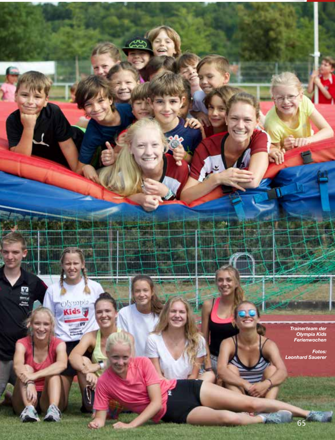
Trainerteam der Olympia Kids Ferienwochen