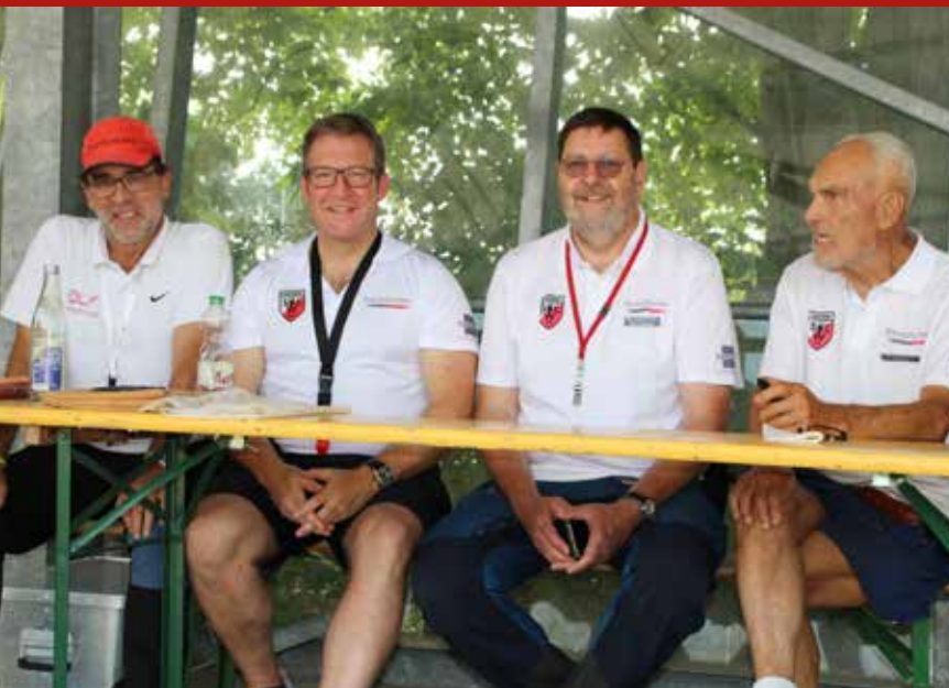
Entspannt: Die Starter- Riege bei den OM Mehrkampf/ Jedermann- Zehnkampf am letzten Juli- Wochenende