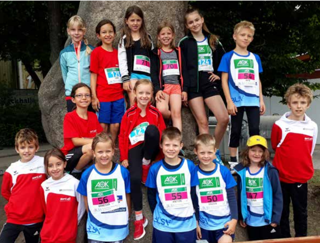
Der SWC-Nachwuchs beim Altstadtlauf am 14. Juli 2019