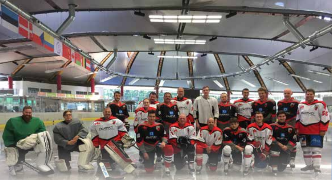
Die Flyers im Trainingslager in Inzell