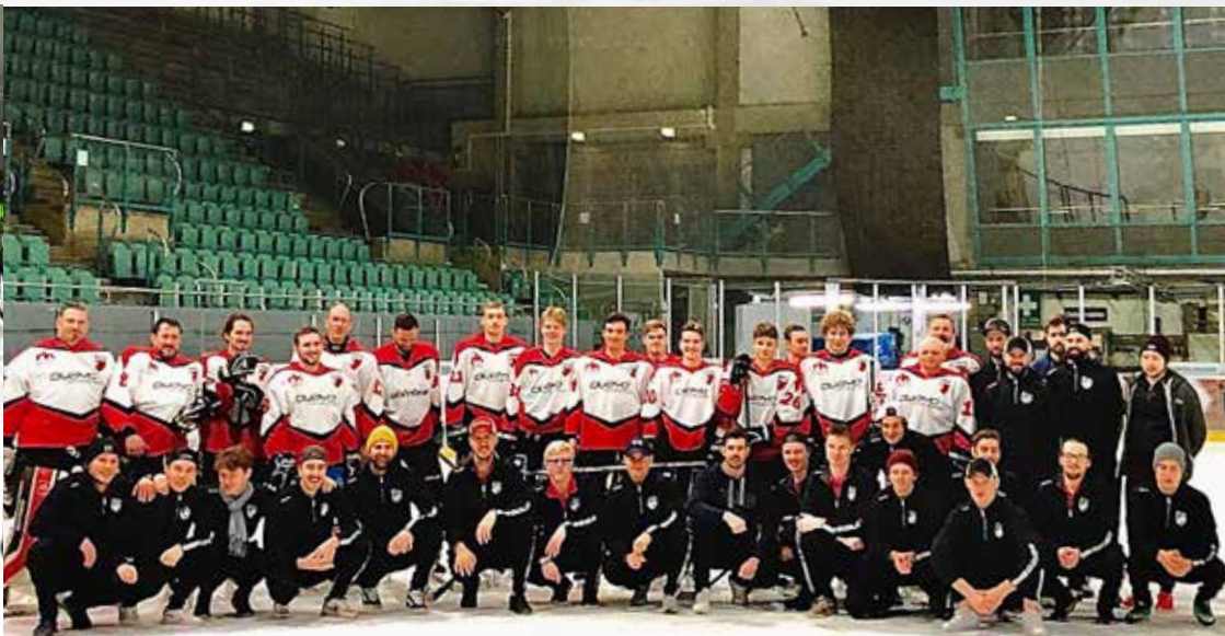
Die SWC Flyers (oben) und unten rechts mit den Profis der Eisbären