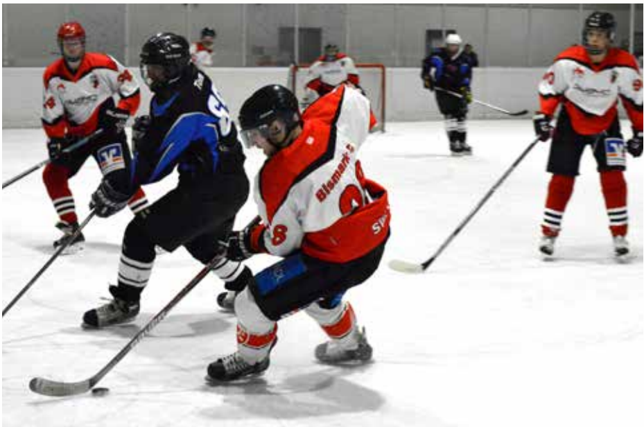
Gespielt wurde nach dem Modus „Jeder gegen jeden“