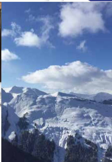
Gemeinsam in Bewegung; Skifahren auf der Schmittenhöhe