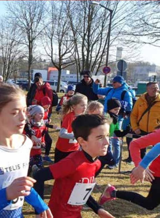
OM-Cross - für die SWC-Kinder ein Heimspiel

Ebenfalls auf Platz Zwei in der W11 landete Freya Hempel mit tollen 4:44.