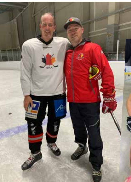
Eindrücke vom IIHA-Camp im Juli in der Donauarena