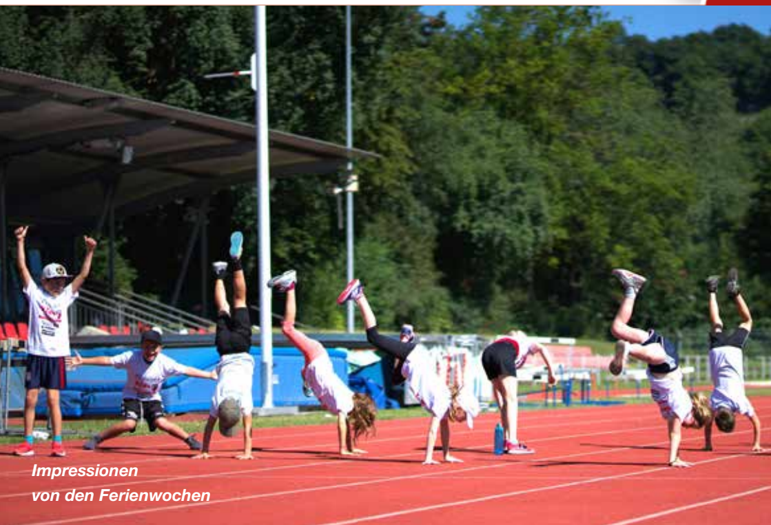
Impressionen von den Ferienwochen