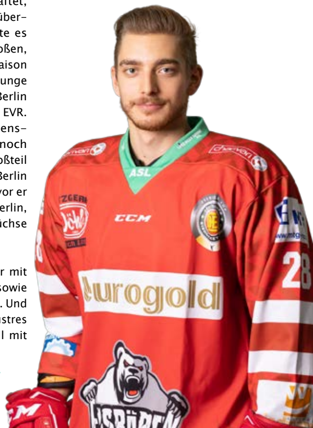
Lars Schiller