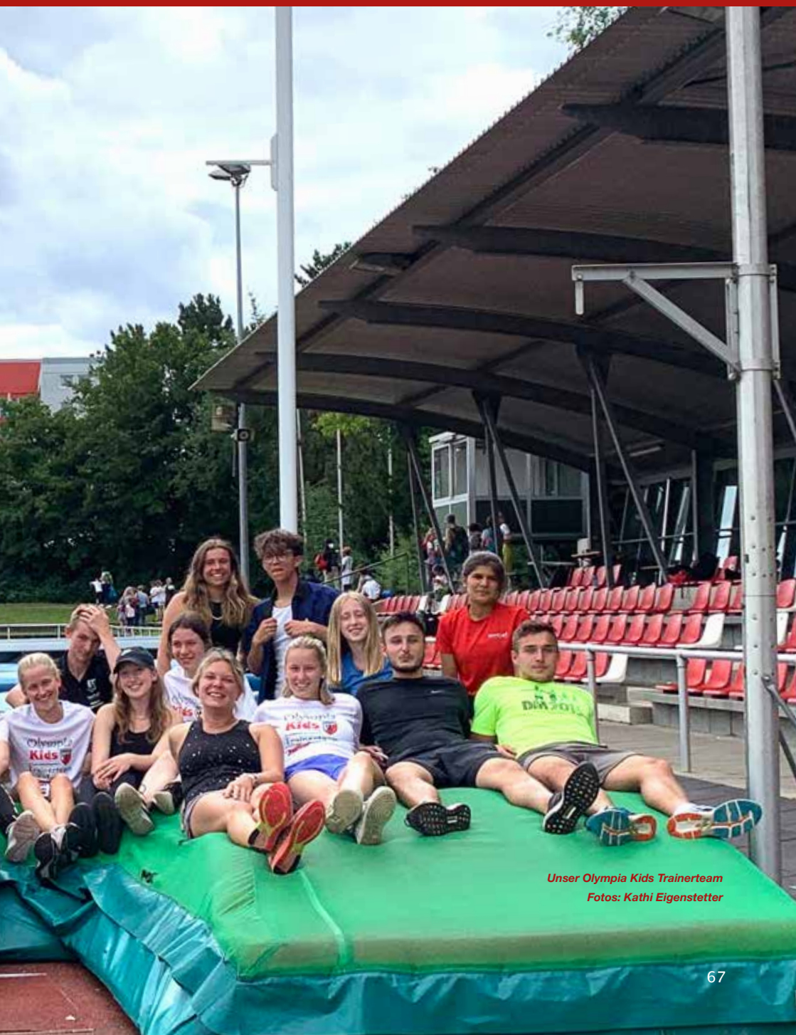
Unser Olympia Kids Trainerteam