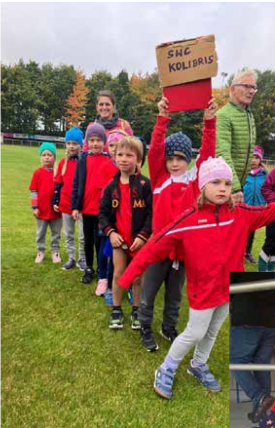
Linke Seite: die Pumas, rechts: die Kolibris