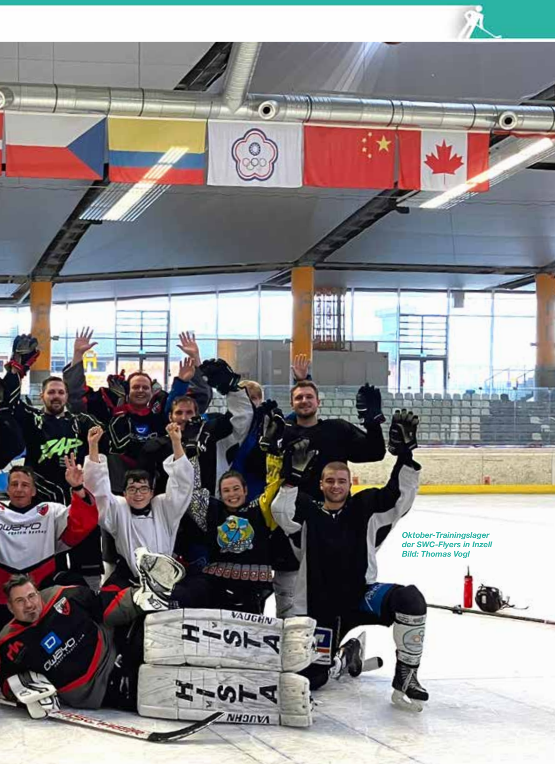
Oktober-Trainingslager der SWC-Flyers in Inzell