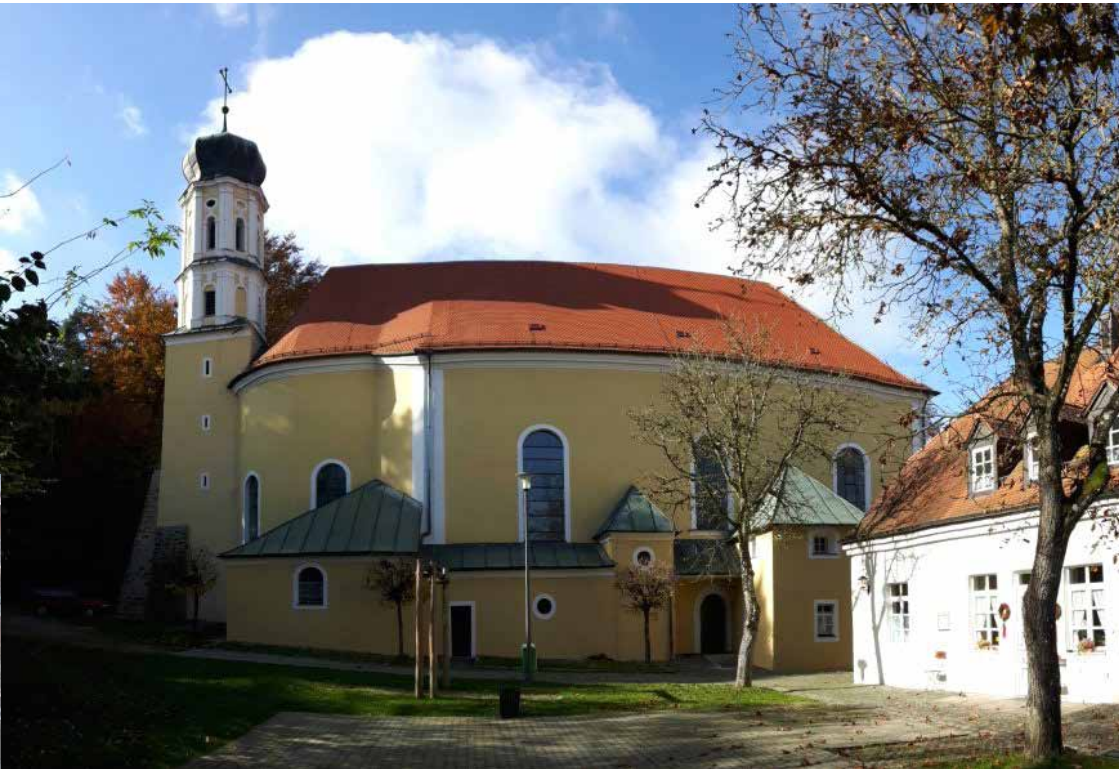
Wallfahrtskirche Heilbrünnl