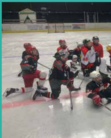
Bilder vom Kinder-Trainingslager in Inzell