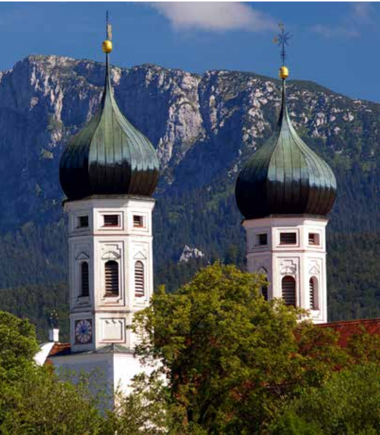
Benediktenwand mit Kloster Benediktbeuern

Nach einer weiteren Übernachtung auf der Hütte geht's am Sonntag zurück nach Bendiktbeuern und für die Wochendwanderer nach Regensburg. Die restliche Wandergruppe übernachtet im Kloster, macht am Montag eine kleinere Wanderung zum Abgewöhnen (9 km/3 h) und fährt am Nachmittag nach Regensburg zurück.