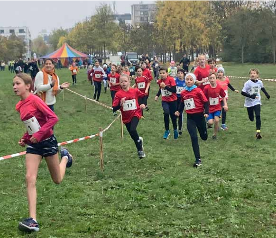
Diese und Seite 40/41: Impressionen von der Crosslauf-Oberpfalzmeisterschaft am Weinweg am 23. Oktober 2022