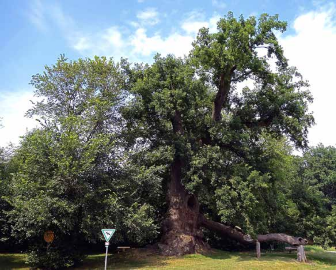
Links: Felsformation im NSG Am Keilstein, Foto: Creative Commons Oben: Sankt-Wolfgang-Eiche, Foto: Creative Commons