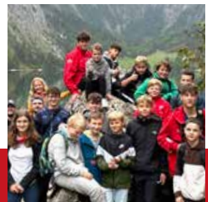
Titel: Die SWC Little Flyers am Königssee