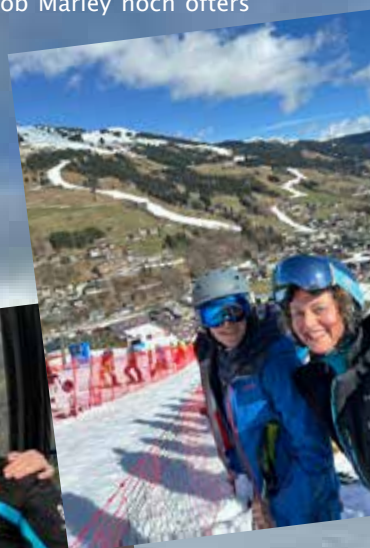
Die SWC-Ski-Übungsleiter bei der März-Fortbildung in Saalbach