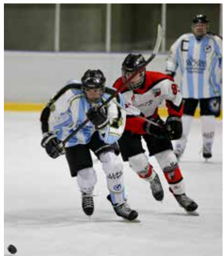
Kondor Ittling gegen SWC White