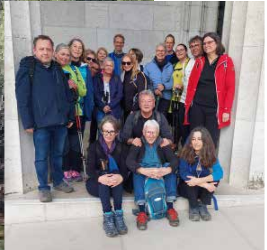
Impressionen von der März-Wanderung