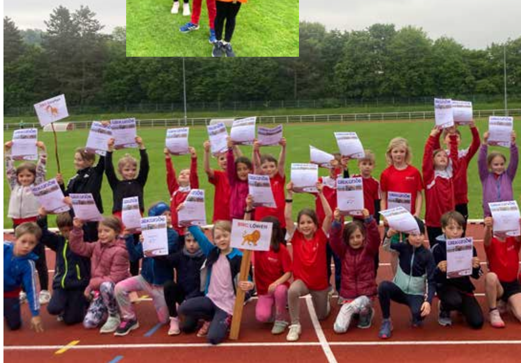
Rechts: SWC U8 - die Kolibris und Schmetterlinge