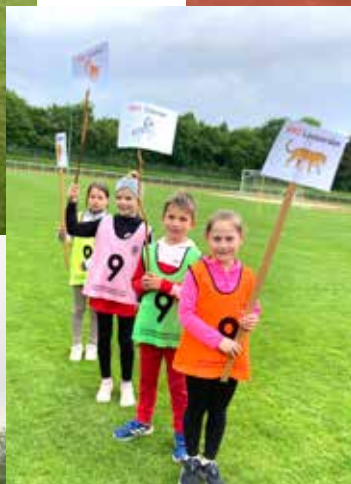
Unten: Die starke SWC U10 mit den Leoparden, Giraffen, Zebras und Löwen