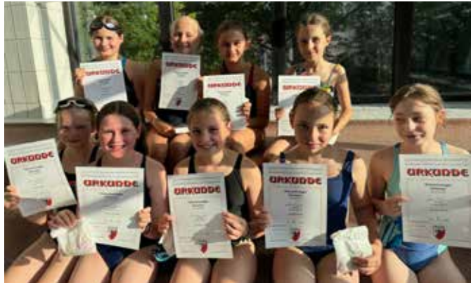
Stolze Schwimmer bei den Clubmeisterschaften