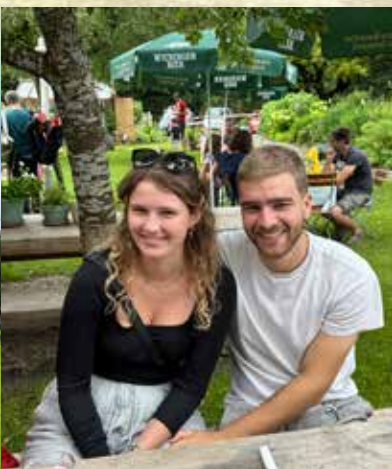
Die SWC Flyers in der Max-Aicher-Arena in Inzell, beim Schlauchbootfahren auf der Kössener Ache und bei der geselligen Brotzeit