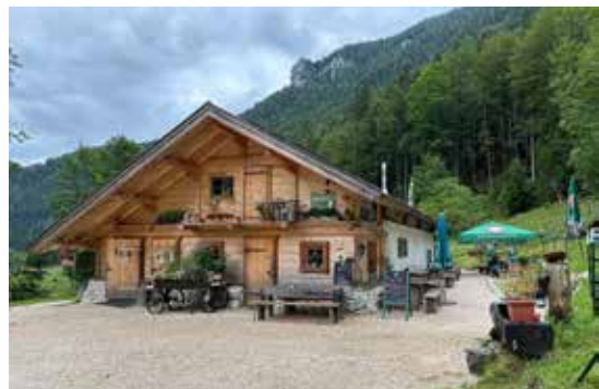
Sonne, Eis und Wasser - Impressionen aus Inzell