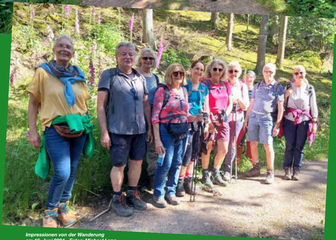
Impressionen von der Wanderung am 16. Juni 2024 - Fotos: Michael Lang