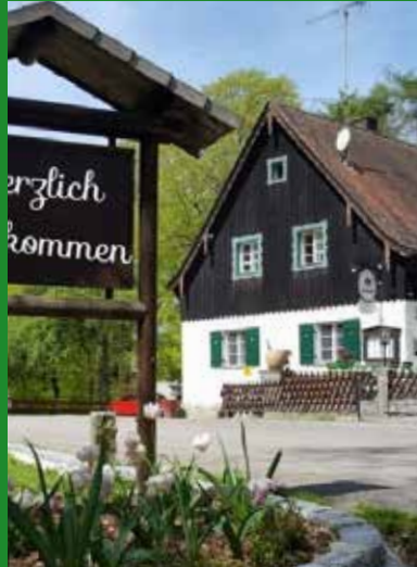
Oben: Waldhaus Einsiedel, Foto: www.oberpfaelzer-seenland.de Links: Pfaffenstein bei Kolmberg, Foto: www.bayerischer-wald.org