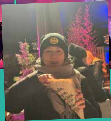
Impressionen vom Trainerausflug nach München