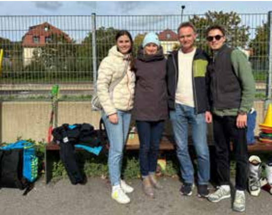
Die SWC-Skifüchse am Start

Der Himmel hatte ein Einsehen; schütete es morgens noch, so schien nachmittags auf den Treffpunkt zur traditionellen Fuchsjagd beim Walhallabockerl die Oktobersonne. Das Attribut traditionell ist übrigens wirklich begründet, die SWC-Fuchsjagd trägt dieses schon in den Clubnachrichten vom Oktober 1959.