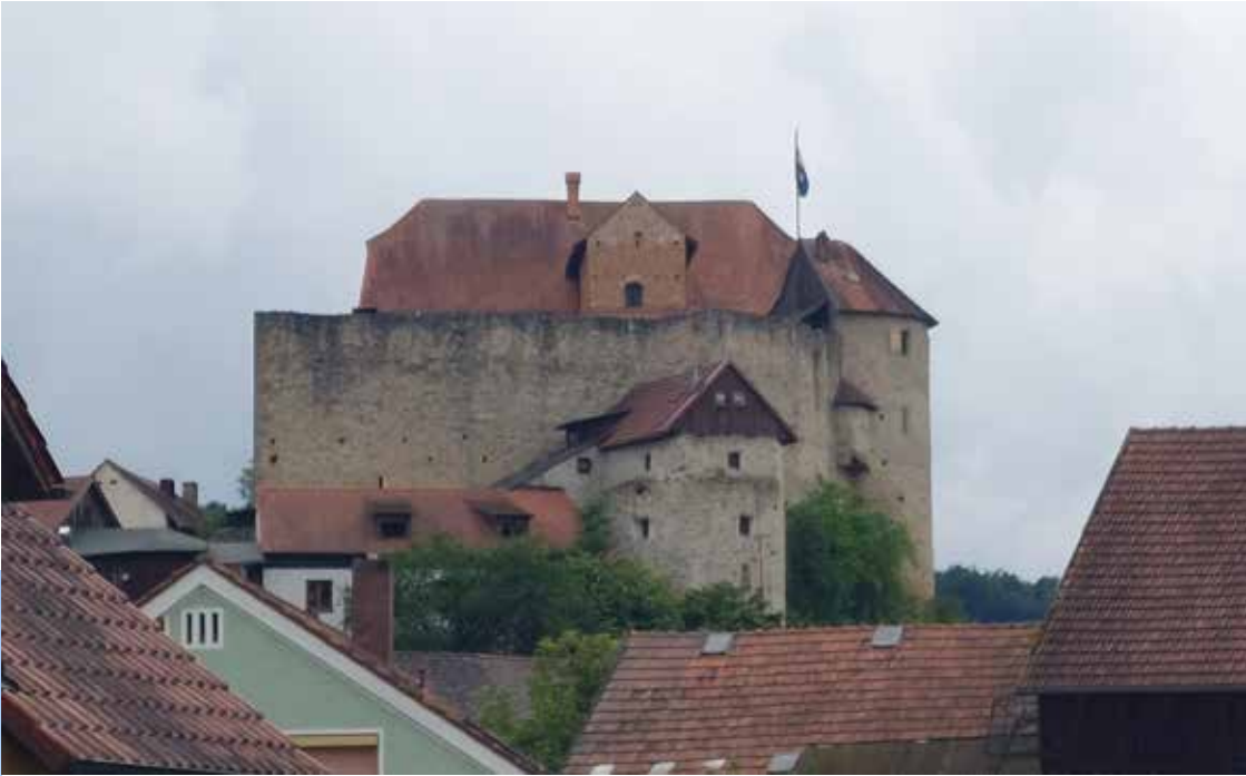
Links: Kallmünz mit Burgruine, Foto: Creative Commons Oben: Burg Wolfsegg