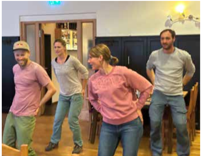
Von oben links im Uhrzeigersinn: Die Funky Panthers, die Kolibris, die Gruppen Foxtrott, Speckknödelsuppe und Fuchsbandwurm bei ihren Tanz- darbietungen im Spitalkeller