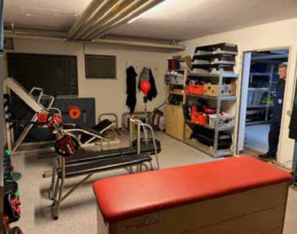
Alles hat seinen Platz im Geräteraum am Weinweg