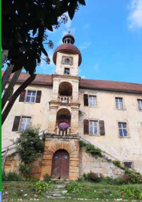
Impressionen von der Septemberwanderung 2025